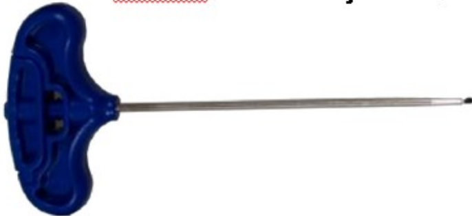
SWVPB , Trocart de vertébroplastie -- Mandrin excentré 11G