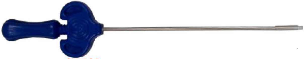
SWBSB Kit de Biopsie + Mandrin poussoir