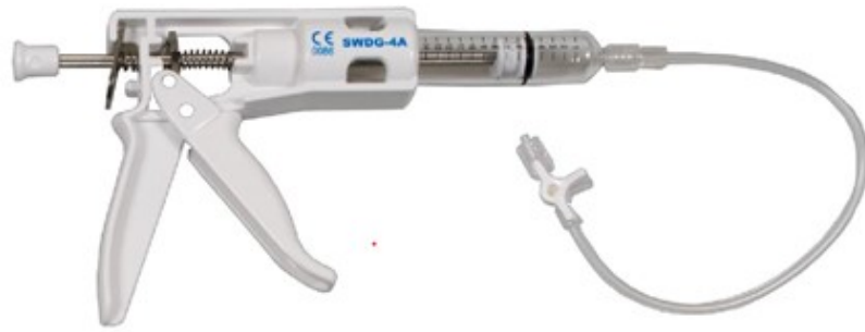
SWDGA , Pistolet Injecteur , Tubulure de connexion