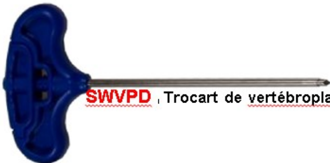
SWVPD , Trocart de vertébroplastie -- Mandrin pyramidal 9G